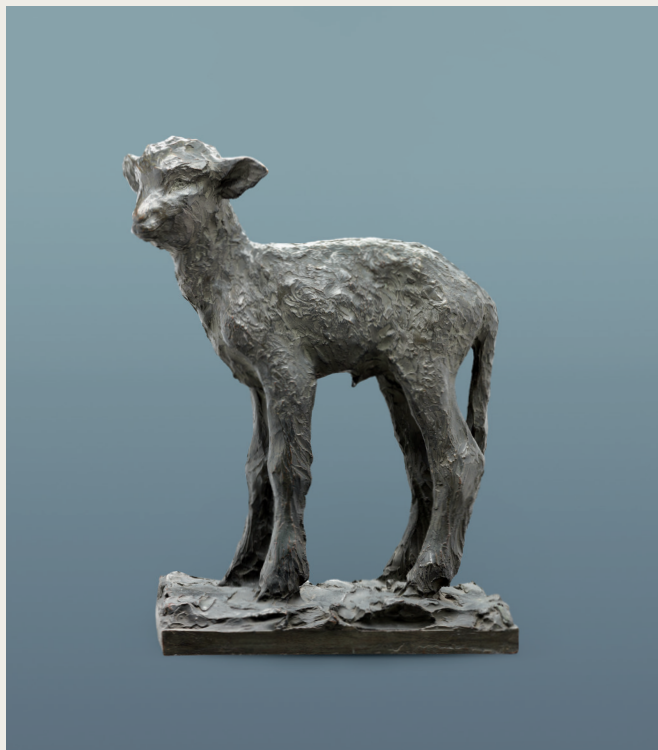
Paul Troubetzkoy | Come potete divorarmi? (Agnello) 1912 - Detroit, Detroit Institute of Arts

La sua vita straordinaria è scandita da incontri e amicizie decisive con artisti e scrittori: Lev Tolstoj, Georges Bernard Shaw, Giovanni Segantini, Joaquín Sorolla e Giovanni Boldini. I ritratti, a cui deve la sua fama, restituiscono il clima di un'intera epoca, ma la mostra mette in luce, attraverso le sculture di animali, anche il lato più sensibile e moderno di questo artista, fervente difensore della causa animalista.