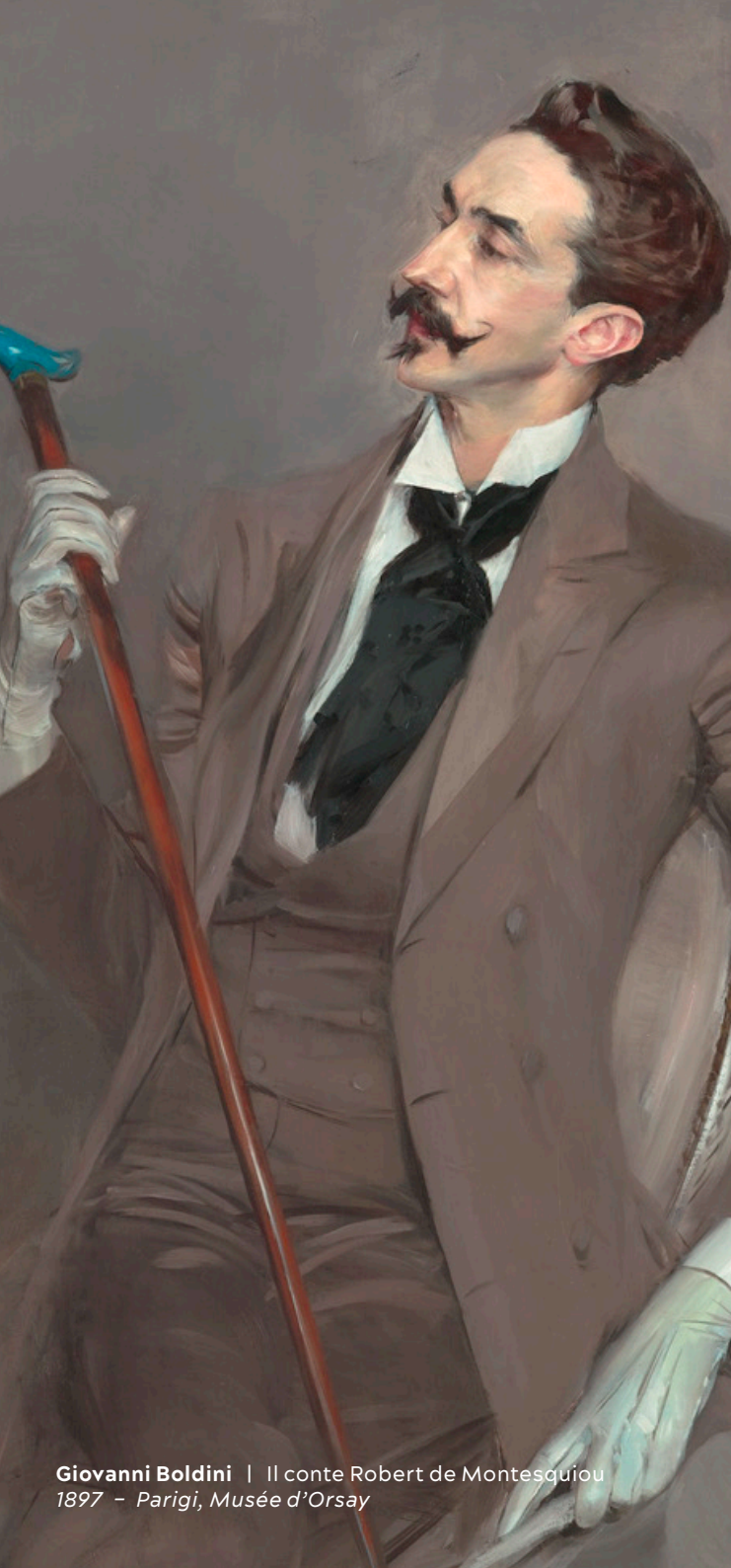
Giovanni Boldini | Il conte Robert de Montesquiou 1897 - Parigi, Musée d'Orsay